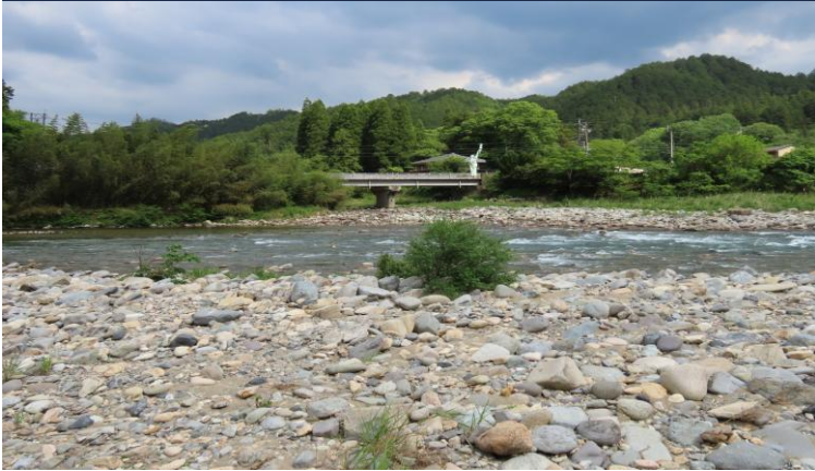
漁場写真（目印：自由の女神像が見える）