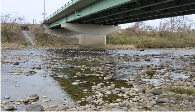
漁場写真（富津橋の下）